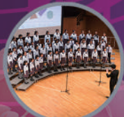
天主教總堂區學校合唱團