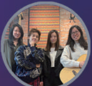
Brain Burn Band