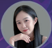
特邀鋼琴演奏家 狄江瑤小姐